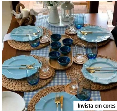
Invista em cores