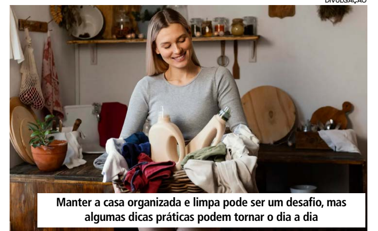
Manter a casa organizada e limpa pode ser um desafio, mas algumas dicas práticas podem tornar o dia a dia

A especialista destaca a importância de manter uma rotina diária de cuidados com o lar, e reservar 15 minutos