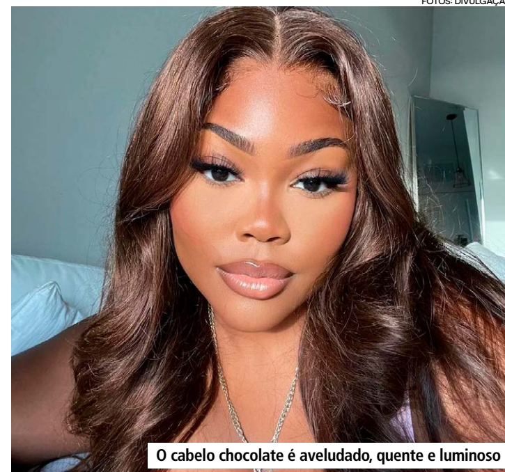
O cabelo chocolate é aveludado, quente e luminoso

O cabelo chocolate é aveludado, quente e luminoso. O tom é considerado um castanho-claro e tem nuance suave, com reflexos que mesclam dourado e cobre. Para 2025, ele se confirma como tendência por empregar naturalidade e sutileza aos fios — aqui você confere mais opções em alta na temporada. Quer saber como? Então confira as três dúvidas mais comuns