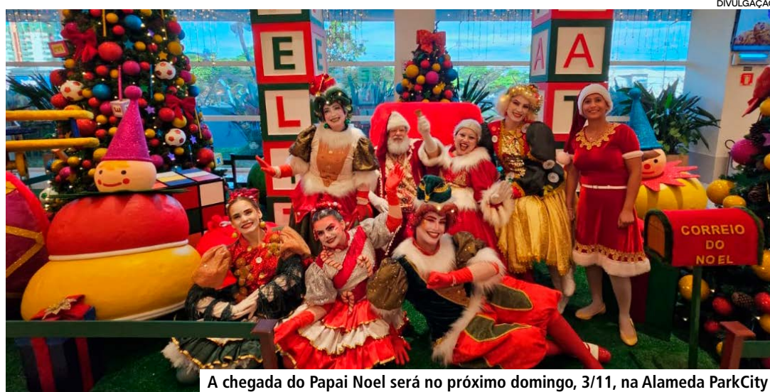
A chegada do Papai Noel será no próximo domingo, 3/11, na Alameda ParkCity

Na semana do Natal, o horário será diferenciado. Na segunda-feira, dia 23 de dezembro, o bom velhinho recebe o público das 13h às 21h, com pausa entre 17h e