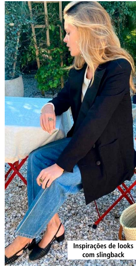
Inspirações de looks com slingback