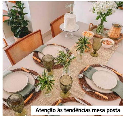
Atenção às tendências mesa posta