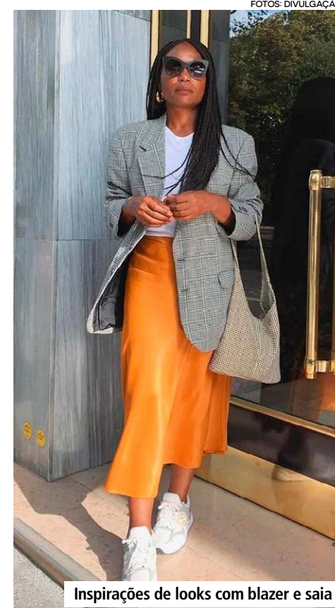
Inspirações de looks com blazer e saia