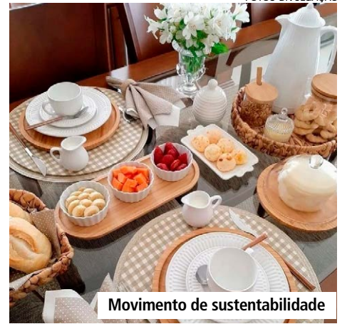
Movimento de sustentabilidade