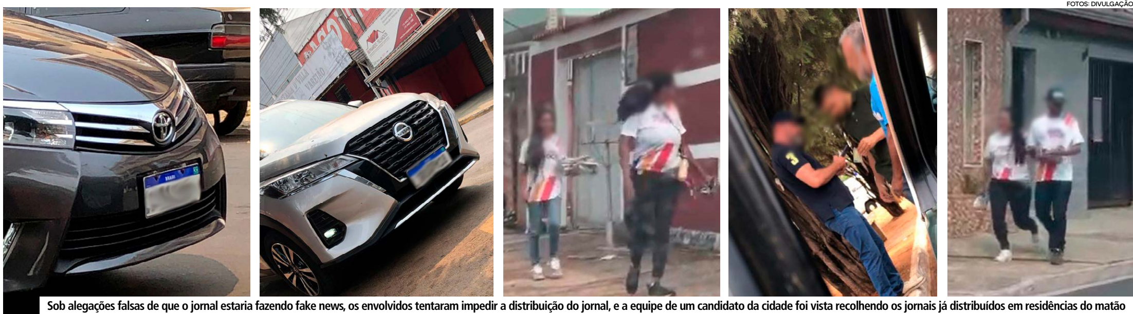
Sob alegações falsas de que o jornal estaria fazendo fake news, os envolvidos tentaram impedir a distribuição do jornal, e a equipe de um candidato da cidade foi vista recolhendo os jornais já distribuídos em residências do matão