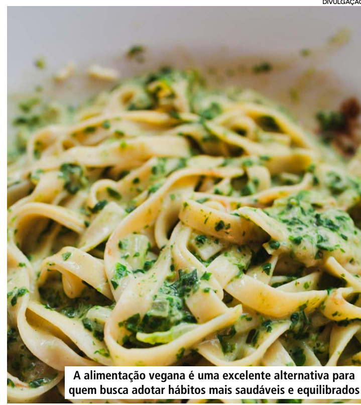
A alimentação vegana é uma excelente alternativa para quem busca adotar hábitos mais saudáveis e equilibrados